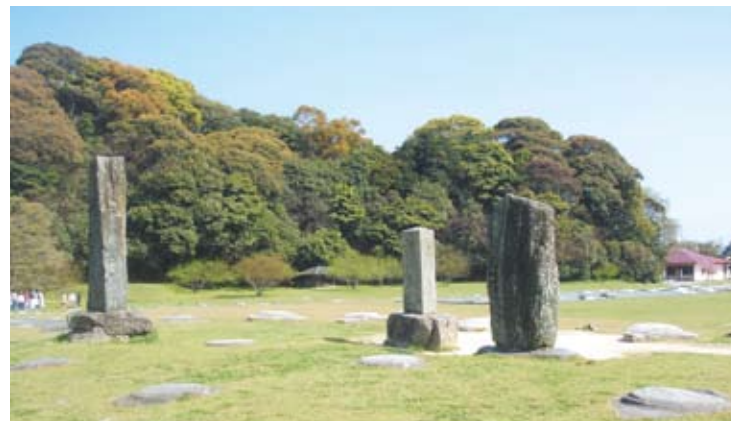
大宰府政庁跡から見た月山(辰山)