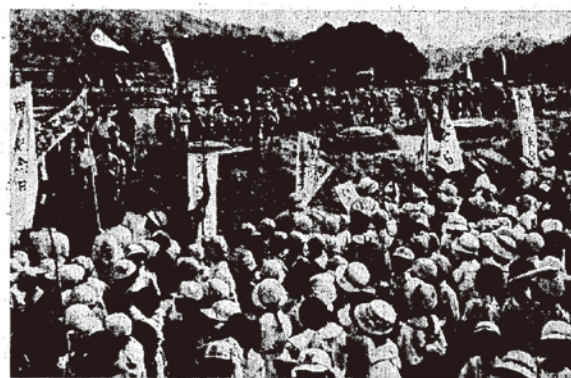
ノボリを立てて都府楼跡へ時刻競争に。水城小の時の記念日行事

江戸時代に記された『太宰府旧蹟全図北図』(1806年)には、政庁東の丘を「時山」と記し、『筑前国続風土記拾遺』には「東の岡を築山といふ。むかしの漏刻樓を置れし所にして辰山といひしを訛りて築山といへり。」と記され、漏刻が政庁東の丘にあったと推定しています。