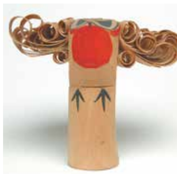
昭和30年代頃の作(高田工房)