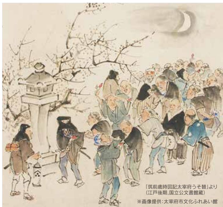
「筑前歳時図記太宰府うそ替」より (江戸後期, 国立公文書館蔵)

太宰府の木うそは、万治年間(1658 ~ 1661 年)製作と伝承される絵図が『天満宮御一代記・絵本菅原実記』に記され、また太宰府天満宮の鶯替神事は、貝原益軒が貞享二年(1685)『太宰府天満宮故実』の中で「正月七日の夜はまづ酉の時ばかりにうそがへといふ事あり」と紹介しており、400 年近い歴史を持っています。