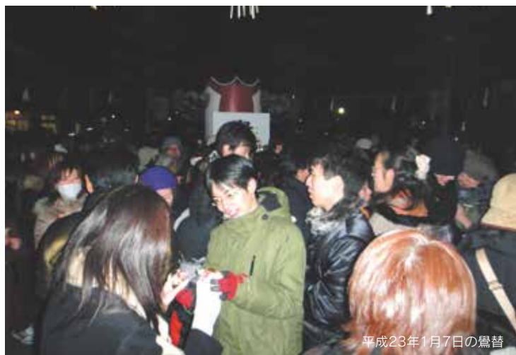
平成23年1月7日の鶯替