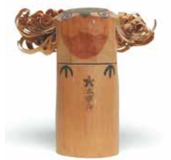
昭和40年代頃の作(占部工房)