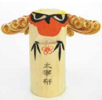
昭和50年代頃の作(岡藤工房)