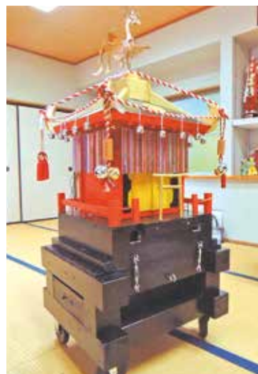
地域の人たちで手作りされる「子どもみこし」