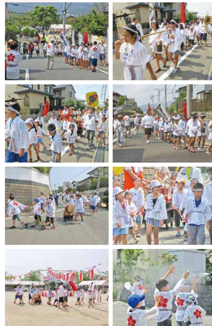
平成30年の子どもみこしの様子