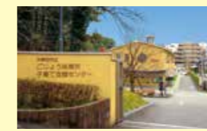
太宰府市役所から750m(歩いて約10分) 西鉄五条駅から450m(歩いて約6分) 駐車場 有