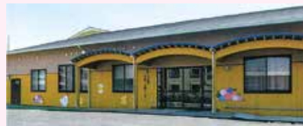
▲県産のスギ・ヒノキをふんだんに使用した木造平屋建て。ランチルームや和室を備え、子育てサロンや講座などを行っていました。

それまでいきいき情報センター内にあった子育て支援センターと、別の場所にあったごじょう保育所を移転。両施設をあわせて市の子育て支援の中核を担う、「総合子育て支援施設」としてオープンしました。子育て世帯の相互交流や相談の場となりました。