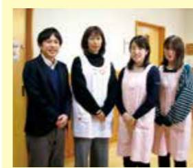
保健師・保育士・社会福祉士・管理栄養士・助産師などの専門職が子どもや子育て世帯をサポートします。