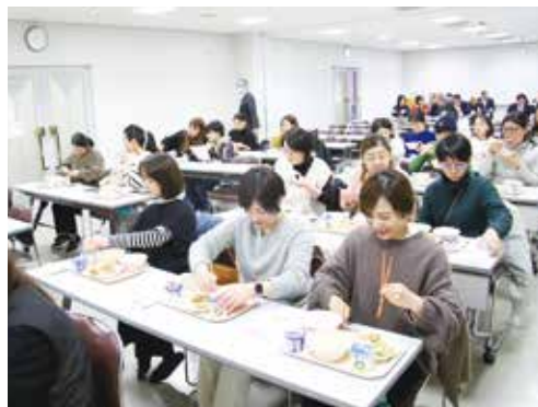
給食を試食する保護者 生徒たちが食べる給食を事前に試食しました

同じ献立をみんなで食べられるのが学校給食の魅力だと思います。生徒たちがコミュニケーションを取りながら食べているのを見て嬉しくなりました。