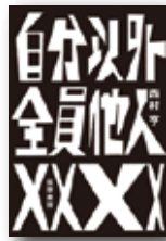
西村亨/著 『自分以外全員他人』 筑摩書房