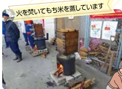
火を焚いてもち米を蒸しています