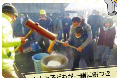
大人と子どもと一緒に餅つき