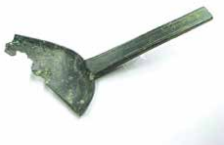
佐波理の匙の破片

匙の細部を見てみましょう。匙面と柄のフチに、幅0.5mmにも満たない細かい線が刻まれています。また、匙面の根元から柄に続く部分や、断面が長方形の柄の角の部分には、工具を使って表面を削った痕跡も確認できます。破片のため全長7.6cmと手