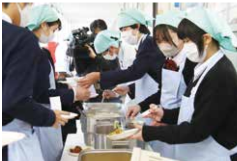
(右)配膳室で受け取った給食を教室へ運びます (上)教室に戻って、食缶に入ったご飯やおかずをお皿につぎ分けながら配膳します

多くの皆さんの協力のもと、中学校完全給食を開始することができました。成長期の子どもたちにとって、給食が健やかな成長のための一助になることを願っています。