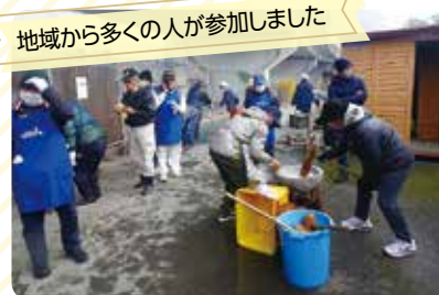
地域から多くの人が参加しました