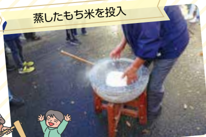
蒸したもち米を投入