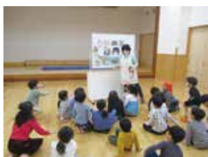
ごじょう保育所の保育士