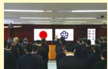
新年のあいさつをする楠田市長