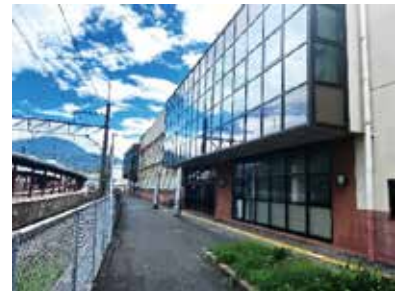
いきいき情報センター1階 (線路沿いの入口から会場に進んでください)