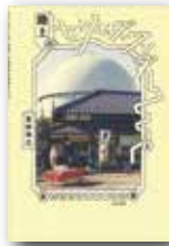
宮田珠己/著 『路上のセンス・オブ・ワンダーと 遙かなるそこらへんの旅』 亜紀書房