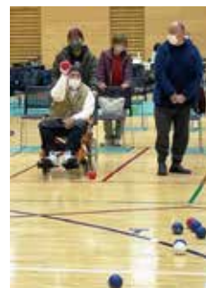
ジャックボール(白球)をめがけて!

ボッチャは年齢や性別、障がいの有無に関わらず楽しめるのが魅力のパラスポーツです。会場では白熱した試合が繰り広げられ、歓声や拍手が送られました。