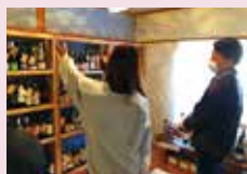
ワインショップの様子