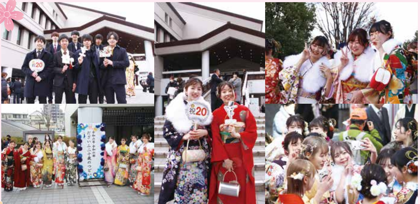
会場前で再会を喜ぶ二十歳の皆さん