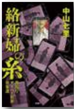
中山七里/著 『絡新婦の糸』 新潮社刊