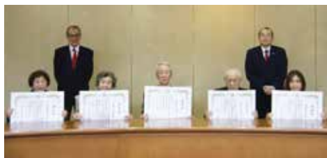
表彰された皆さん(前列)