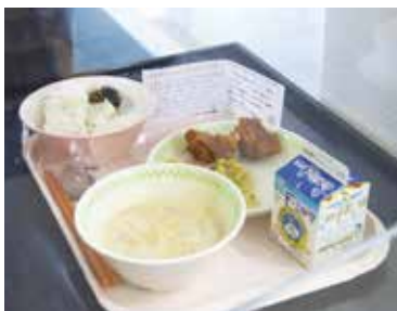
「令和の都だざいふ」献立 ・むぎご飯 ～うめのりを添えて～ ・さわやか唐揚げ～梅サイダー風味～ ・野菜とツナのうめえたれ和え ・梅はちみつ味ポテトチップス入り豆乳スープ

待ちに待った給食スタート 令和6年1月10日、太宰府市立中学校全4校で待望の完全給食がスタートしました。これまで牛乳のみを提供するミルク給食と希望者が注文できるランチサービスを提供していましたが、今後は生徒全員に、栄養バランスの考えられた完全給食を提供します。 当日は、各クラスの給食当番が配膳室で給食を受け取り、教室に戻ってお皿につぎ分けました。生徒たちは先生の声に耳を傾けながら協力して作業を進め、「いただきます」の後は笑顔で食事を楽しみました。