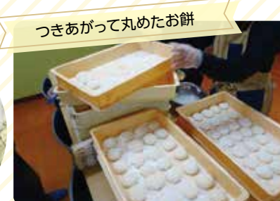
つきあがって丸めたお餅