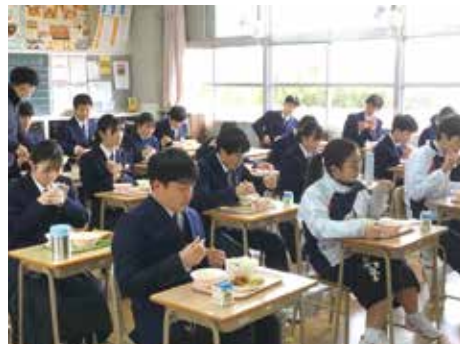
太宰府東中学校の給食の様子 学校によって席の配置はさまざまでした