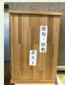
太宰府館 俳句・短歌ポスト