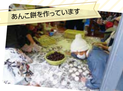
あんこ餅を作っています