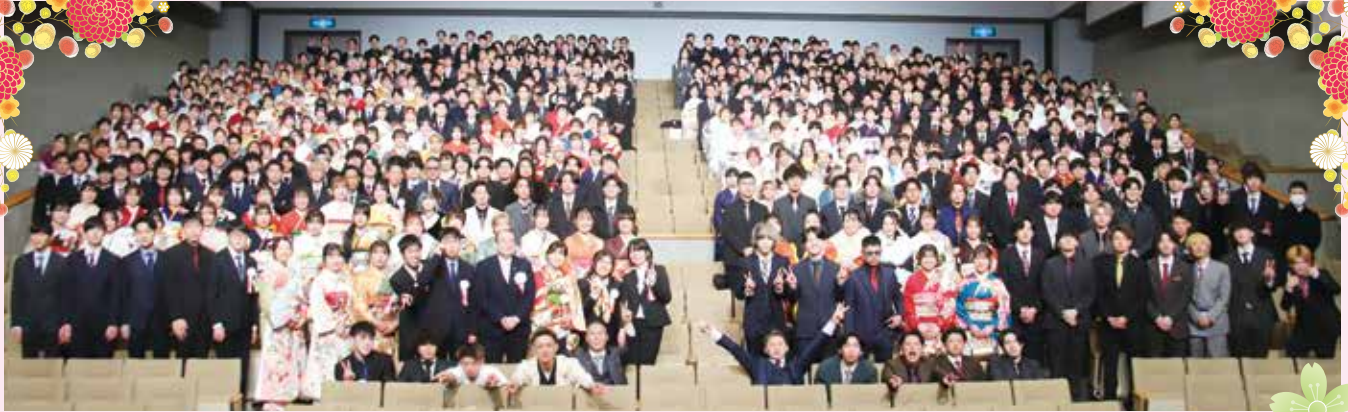
二十歳のつどい出席者

令和の都だざいふ二十歳のつどいを1月7日(日)にプラム・カルコア太宰府 (中央公民館) で開催し、市内の752人が人生の節目である20歳を迎えました。コロナ禍以来、中学校区で2部に分けて開催していましたが、本年は4年ぶりに出席者が一同に集いました。会場は旧友との再会を喜ぶ20歳を迎えた皆さんの笑顔であふれていました。皆さんの新しい人生の門出をお祝いし、今後の活躍を期待します。