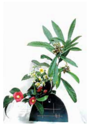
なかしま きみこ 中島 公子 (国分区) 草月流