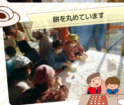
餅を丸めています