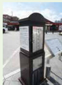
太宰府駅前 俳句・短歌ポスト