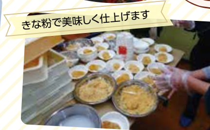
きな粉で美味しく仕上げます