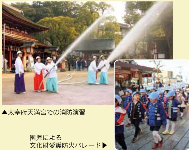
▲太宰府天満宮での消防演習