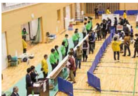
昨年度公売会の入札の様子