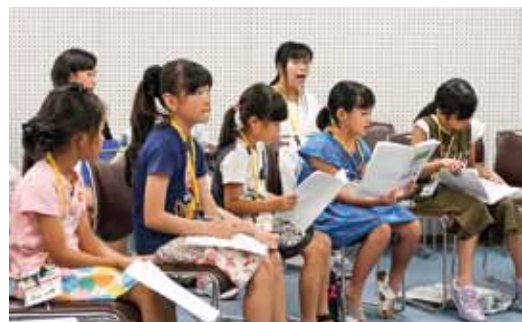
小学1年生～中学3年生27人が楽しく熱心に練習しています。