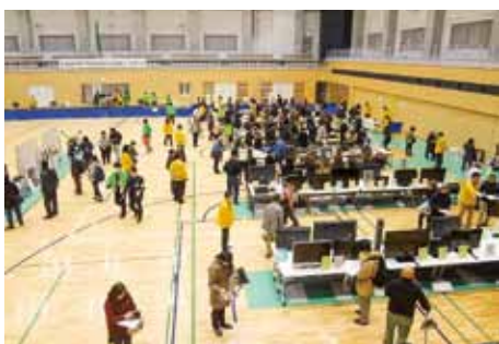
昨年度公売会の様子