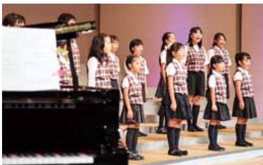
地域の音楽イベントにも精力的に出演しています。