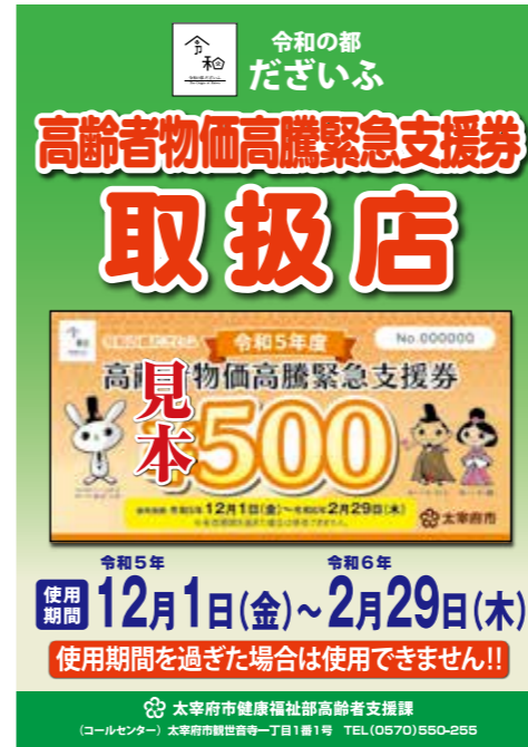
取扱店舗・事業所はこのポスターが目印です

対象者 本年10月1日現在、本市住民基本台帳に登録がある65歳以上の高齢者がいる世帯の世帯主。 ※ただし、令和5年度太宰府市エネルギー・食料品価格等高騰低所得世帯支援給付金の支給を受けた人は除きます。 給付額 1世帯当たり1万円(500円券×20枚) 給付方法 12月初旬に、対象世帯へゆうパックで順次送付します。不在などで商品券を受け取れなかった場合 ①郵便局に再配達を依頼する。 ②郵便局で受け取る。 不在連絡票・認印・本人確認書類(運転免許証など)が必要です。詳しくは郵便局へ問い合わせてください。 筑紫野郵便局 ☎0570(943)384 使用期間 12月1日(金)～令和6年2月29日(木) ※使用期間内のみ有効です。使用できない商品もあります。券の裏面に記載しています。 使用できる店舗など 市内取扱登録店舗・事業所。商品券送付時に一覧表を同封します。 問い合わせ ・コールセンター ☎0570(550)255 ・相談窓口は太宰府市役所4階402会議室 ※いずれも平日の開庁時間中