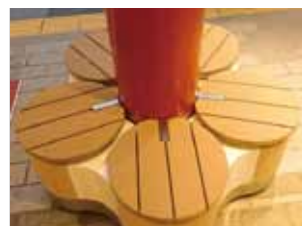
うめの形のベンチ