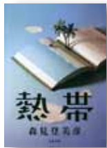
『熱帯』 森見登美彦/著 文藝春秋

●その他の本 ここからセクハラ!(牟田和恵/著) 博多に強くなるう北九州に強くなるう(上・下)(西日本シティ銀行/編) ヒンメリをつくる(山本睦子/編) 稼げる!農家の手書きPOP&ラベルづくり(石川伊津/著) 文字組デザイン講座(工藤強勝/著) 答えのない世界に立ち向かう哲学講座(岡本裕一郎/著) 未来の図書館、はじめます(岡本真/著)