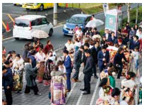
多くの新成人であふれる会場