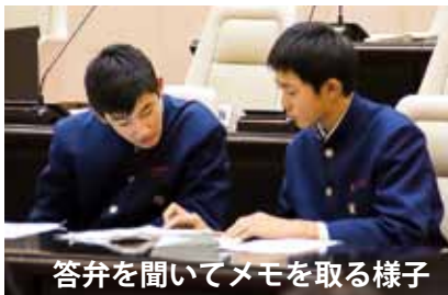
答弁を聞いてメモを取る様子