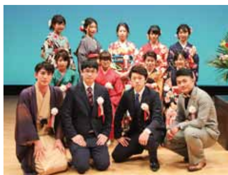
実行委員の皆さん