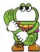
いざという時のために通話を開始すると自動録音