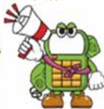
通話相手に会話の内容を録音することを事前通告