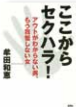
『ここからセクハラ!アウトがわからない男、もう我慢しない女』 牟田和恵/著 集英社