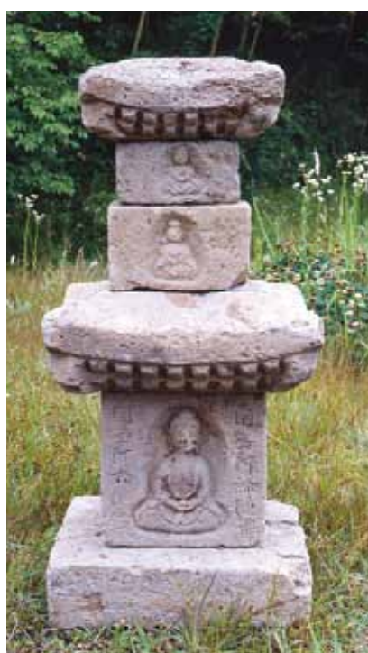
写真1 伝原山本堂跡で発見された層塔