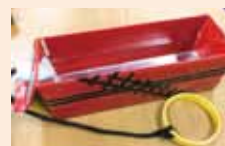
手作りのひっぱり車