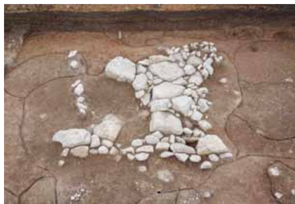
写真2 伝原山本堂跡の発掘調査で出土した石組