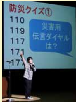
大学生の意見発表