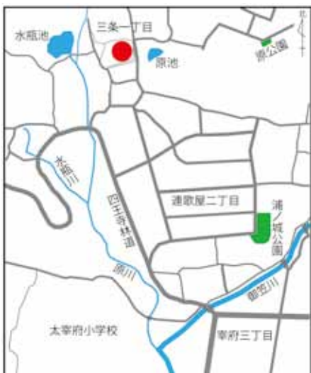
伝原山本堂跡位置図 (赤印が伝本堂跡)

昭和45年の石塔の発見から47年が経過した平成29年9月から平成30年7月に、層塔が発見された伝原山本堂跡の発掘調査を行いました。本堂と考えられる新旧2棟の礎石建物跡などととも石組（写真2）が出土しました。この石組は、2棟の礎石建物と重複する位置に造られ、礎石建物が建てられていた時代の直後である14世紀代に造られたと考えられます。14世紀代に堂社がなくなった後も、この地が本堂の跡地であり、原山での信仰の中心地であることを