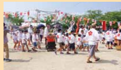
▲新認定市民遺産 「梅香苑夏まつり子どもみこし」

チラシや景観・市民遺産会議HP( http://www.市民遺産.jp/ )もご覧ください。