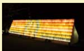
ランタンウォール