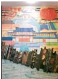
市役所ロビーの 木彫壁画