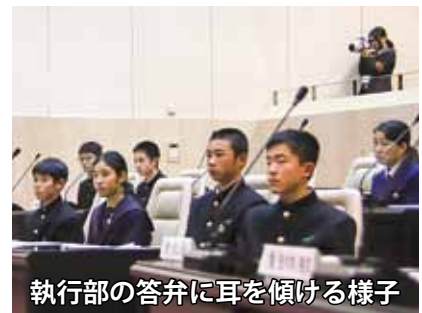
執行部の答弁に耳を傾ける様子