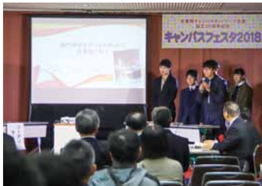
大学生リーダーフォーラム

同団体の設立20周年を記念した式典をはじめ、「太宰府の魅力を再発見！」をテーマに、市内5大学の学生混合グループによる大学生リーダーフォーラムが行われました。さらに大学生によるステージ発表やワークショップのほか、今回は特別企画として市内高校も初出展し、活気溢れるイベントとなりました。