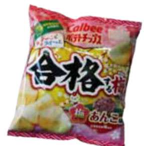
梅研究班の皆さんがデザインしたパッケージ

「梅あんこ味」は、梅の酸っぱさとあんこのやさしい甘さが絶妙にマッチした逸品で、昨年12月10日(月)から一般発売が始まっており、本市のふるさと納税の返礼品としても提供されています。