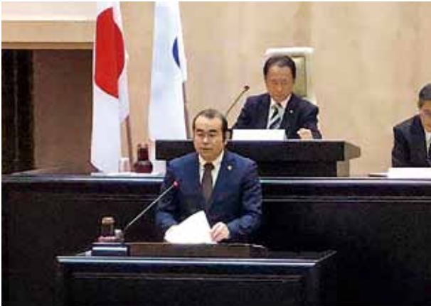
第4回定例会冒頭あいさつ