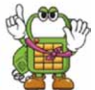
電話に出る前にアナウンスで迷惑電話の注意喚起