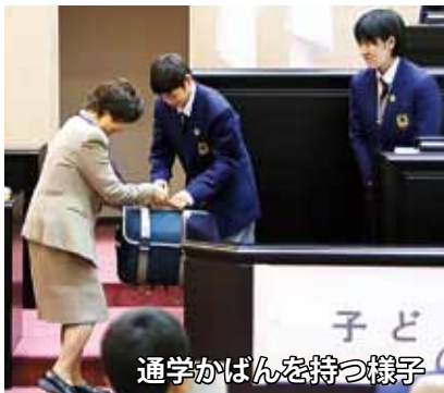
通学かばんを持つ様子