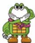
迷惑電話番号リストの電話番号を自動で着信拒否