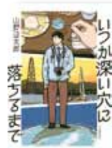
『いつか深い穴に落ちるまで』 山野辺太郎/著 河出書房新社