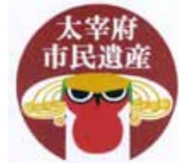
太宰府市民遺産 ロゴマーク

本市では、自然と歴史と暮らしが調和した活力と魅力ある住みやすいまち、百年後も誇りに思えるまちの実現を目指し、景観づくりや太宰府市民遺産の育成に取り組んでいます。未来へのためである景観や市民遺産を、子どもから大人まで丸一日楽しめるイベントを開催します。ぜひお越しください。