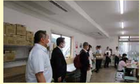
障害者支援施設宰府園

調査先：筑紫保育園、太宰府くじら保育園、 五条くじら小規模保育園、障害者支援施設宰府園、 特別養護老人ホームサンケア太宰府ユニット