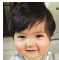
26日 ふるつみ さら フルツティ 咲来ちゃん