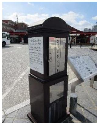
太宰府駅前 俳句・短歌ポスト