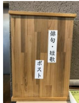
太宰府館 俳句・短歌ポスト