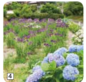
政庁跡への道すがらでも発見!!

観 世音寺から政庁跡までは歴史の散歩道を歩きます。途中にもおすすめスポットがあるので、全然飽きません!あつという間に政庁跡です。政庁跡の後殿跡奥には八つ橋があり、たくさんの紫陽花と花菖蒲に囲まれながら歩くことができます。