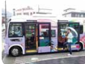
「ゆめ・未来」と一緒に出発の様子

太 宰府天満宮の菖蒲が好きな僕♪ しっかりと堪能した後は、「まほろば号」でいざ、観世音寺へ。太宰府駅バス停で乗車し、観世音寺前バス停で降車です。観世音寺と戒壇院には雨の中でも花菖蒲や紫陽花が美しく咲いています。参道や裏手にも隠れ菖蒲や隠れ紫陽花が咲いていますよ♪ 皆さんも散歩しながら見つけてくださいね!