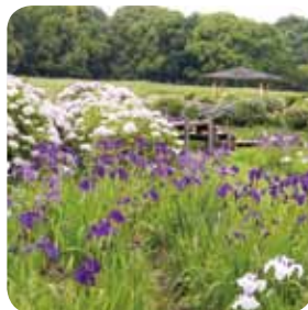
八つ橋のそばには東屋も♪

政 庁跡周辺にも絶好の散歩コースがあります。政庁通り沿いの園路を学業院中学校方向に進んでいくと、誘われるかのように一直線の紫陽花が迎えてくれます。昔の路を歩いているようにも錯覚することも僕のおすすめスポットです! たくさん散歩した後は、「まほろば号」で帰ります。大宰府政庁跡バス停から乗車し、太宰府駅バス停で降車します。バスに乗るだけでなく、歴史を感じる「バス旅」を皆さんもぜひお試しください♪