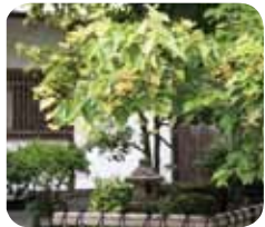
戒壇院の菩提樹も見頃ですよ♪