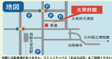
当館には駐車場がありません。コミュニティバス「まほろば号」をご利用ください。