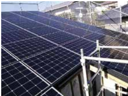
家の屋根に設置した太陽光発電システム