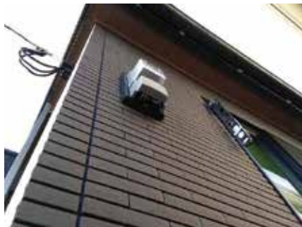
家の壁面に設置したスマートメーター

補助対象 令和3年10月1日以降に契約し設置(購入)した次の設備(ZEHは別途基準あり)