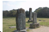
都府楼跡の顕彰碑

地名の由来である古代の大宰府関連史跡は、中世からさいふまいりの名所地となり、様々な人々によって継承・保護され、現在は「史跡のまち太宰府」と呼ばれるに相応しい景観を残している。