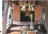
吉松宝満宮の宮座

神社を中心に形成された集落は、天満宮門前町以外は農村集落で、宮座を中心とした農耕祭事が残り、田畑が少なくなった現在でもその面影を見ることができる。