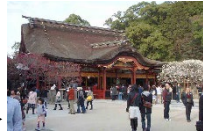
太宰府天満宮参拝風景

太宰府天満宮参詣に訪れる人々が市内の名所を巡る「さいふまいり」。そして、参詣者とその往来をもてなしている人々が織りなす賑わいが門前を中心に今も続く。