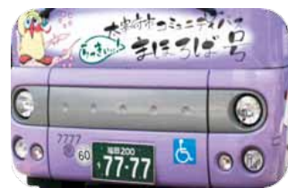
▲車号が7777で、ナンバープレートも「77-77」!! ラッキーセブンです♪

市内で1台のみ走っている「らっきいいい! まほろば号」。外装も内装も他の車両と全く別物!! 乗れたらラッキー!! 見かけるだけでもラッキーかも♪