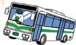
福岡県広報部長「エコトン」