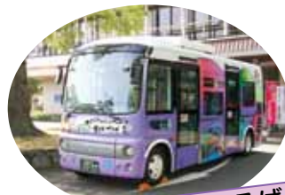
らっきいいい! まほろば号

市内で1台のみ走っている「らっきいいい! まほろば号」。外装も内装も他の車両と全く別物!! 乗れたらラッキー!! 見かけるだけでもラッキーかも♪