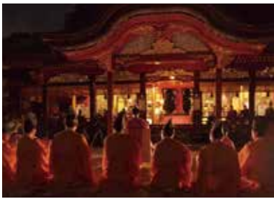
太宰府市民遺産候補「竹の曲」