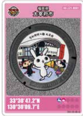
マンホールカード(表面)

世界に誇れる文化物である日本のマンホール蓋を皆さんに楽しく伝え下水道に理解・関心を深めてもらうため、全国の自治体でマンホールカードを配布しています。 今回、とびうめアリーナのデザインのマンホールカードを配布開始します。デザインの元となったカラーマンホールはとびうめアリーナ前に設置しています。他にも客館跡デザインのマンホールカードを大宰府展示館で配布しています。 配布日時 1月28日(土) 午前9時～午後10時 配布場所 とびうめアリーナ(総合体育館) 休館日 毎月最終水曜(祝日の場合は翌日)、年末年始 ※休館日は市役所1階総合案内にて配布します。