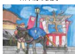
「人の思いがつかぐ梅上げ行事」 岡元 聡子(水城西小6年)