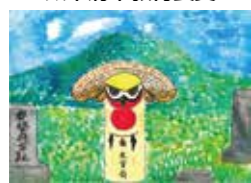
「木うそに願いを込めて」 江上 周真(水城西小6年)