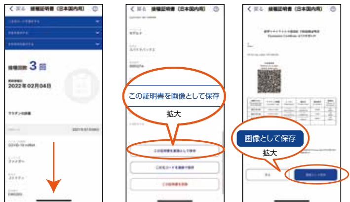
画面を下に移動して