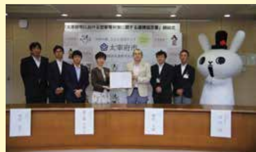
協定締結式の様子

筑紫地区としては初めての協定で、今後ますますの空家 対策の総合的推進を目指します。