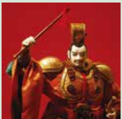
曹操(飯田市川本喜八郎人形美術館(C)有限公司川本プロダクション) 東京国立博物館特別展にて