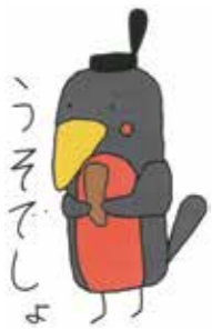
おもてなしプロジェクト オリジナルキャラクター「うそでしよ」

期日、期間、開催日 時間 開館所 時間 休館所 日 場所 対象、資格 内容 期日、定数 講師 料金、費用 託児 持参するもの 申し込み 締切 問い合わせ 主催