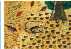
昨年の応募作品の一部

太宰府市民遺産を題材とした絵画作品を募集します。太宰府市民遺産全16件は、文化ふれあい館で開催中の「太宰府市民遺産パネル展」(会期9月11日(日)まで・入場無料)でくわしく紹介しています。 応募対象 市内在住または在学の小学4～6年生 応募点数 1人につき1枚 (題材にする市民遺産は複数選んで可) 応募に用いる素材 ・用紙：八つ切り画用紙(折り曲げずに提出してください) ・画材：自由 注意事項 未発表の作品に限ります。 応募方法 市役所2階文化財課(平日のみ)へ提出。通っている市内小学校を通じて応募することもできます。 応募締切 9月16日(金)午後5時まで 応募作品の一部は市内施設などで展示を予定しています。入賞・入選作品を選定し表彰します。 募集要項・応募用紙は文化財課窓口で配布しているほか、市ホームページでもダウンロードできます。 市民遺産の詳しい情報はこちら