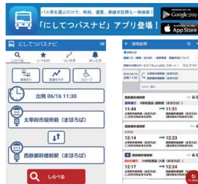
にしてつバスナビアプリの画面イメージ