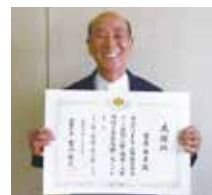
福岡法務局長表彰

人権擁護委員は、地域住民からの人権に関する相談対応やさまざまな人権啓発活動を行っています。今回、多年にわたる人権擁護活動への尽力が認められ、表彰を受けました。