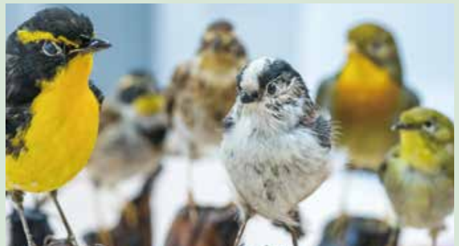
衝突した鳥たちは、ときどき剥製として展示室でも紹介しています。左からキビタキ、ミヤマホオジロ(オス、メス)、エナガノウシチョウ、メジロ

そこで九博では、野鳥の命を守るため、さまざまな研究や取り組みを行っています。たとえば、野鳥が恐れるフクロウの置物を置いてみる、猛禽類の声を流してみる、ガラスがあることを知らせるためガラス壁の内側にLEDライトを灯してみる、など。このような努力のかいあって、一時期よりぶつかる鳥の数は減ってきています。