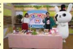
はっけんTVのスタジオ風景