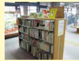
市民図書館「ヒノデ文庫」

同社には本制度開始前の平成6年度から、継続して多くの寄附をいただいています。これまで寄附金は図書購入費に活用し、市民図書館の「ヒノデ文庫」として、外国語資料や児童図書などの設置に充てさせていただきました。市民図書館の入口に入って右手に「ヒノデ文庫」のコーナーを設けていますので、ぜひ一度ご覧ください。