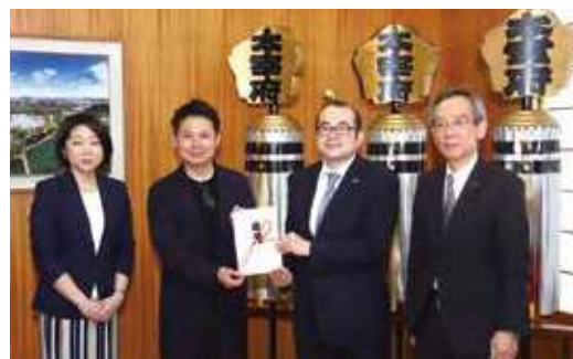
使途：「太宰府市まち・ひと・しごと創生 総合戦略」推進プロジェクト