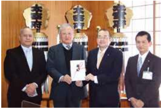
使途：令和発祥の都太宰府「梅」プロジェクト