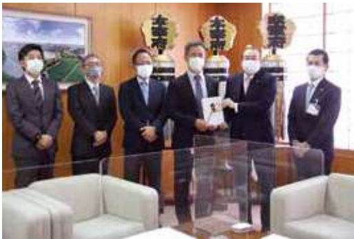
使途：令和発祥の都太宰府「梅」プロジェクト