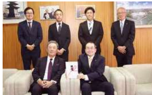
使途：「太宰府型全世代居住場所と出番構想」 (移住定住戦略)事業