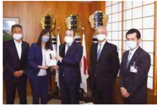
使途：令和発祥の都太宰府「梅」プロジェクト