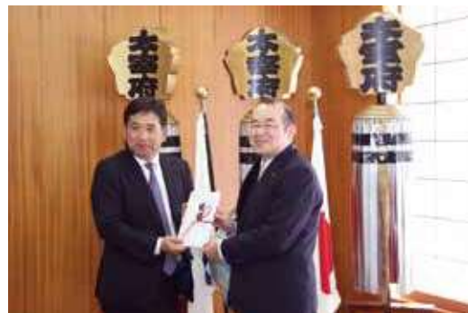
使途：令和発祥の都太宰府「梅」プロジェクト