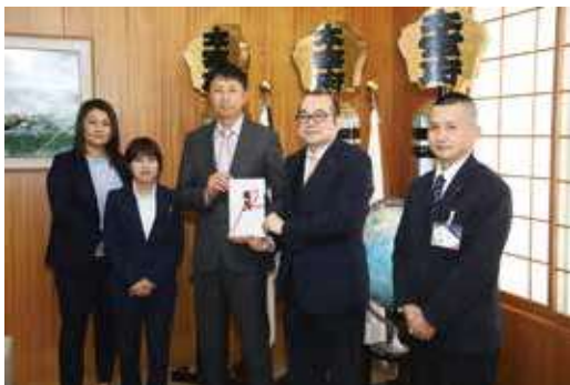
使途：令和発祥の都太宰府「梅」プロジェクト