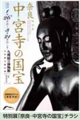
特別展「奈良・中宮寺の国宝」チラシ

なお、この展示会は新型コロナウイルス感染症予防のため、 全てのお客様が事前にオンラインでの来場日時の予約・購入が必要 です。詳しくは九州国立博物館ホームページや、市内公共施設に配架しているチラシをご覧ください。