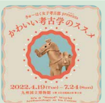
「きゅうはく女子考古部プレゼンツ かわいい考古学のススメ」チラシ

九博で開催中の特集展示「きゅうはく女子考古部プレゼンツ かわいい考古学のススメ」では、そんな「かわいい」考古資料を選りすぐった展覧会です。専門的な知識がないと博物館は楽しめない、なんてことは全くありません。目の前にある作品の魅力を感じてみてください。