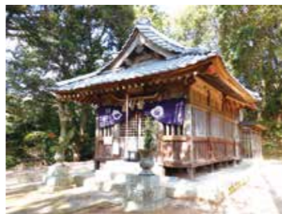
第6回だざいふ景観大賞 『日吉神社本殿・拝殿』