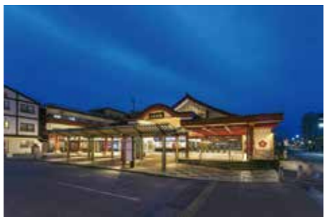
第6回市長賞 『西鉄太宰府駅 駅舎』

だざいふ景観パネル展 5月9日(月)～20日(金)に、太宰府市庁舎1階市民ギャラリーにて受賞作品のパネル展を開催します。ぜひお立ち寄りください。