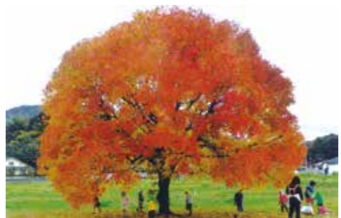
第2回市長賞 『学校院跡のカイの木』