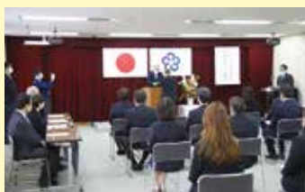
退職者辞令交付式の様子

年度の節目として、本市の退職者辞令交付式を3月31日(木)、新規採用、人事交流職員、異動職員への辞令交付式を4月1日(金)にそれぞれ行い、永年市政へ貢献してくれた退職者14人、新たな意欲で臨む新規採用職員14人と異動職員が辞令を受け取りました。また、恒例の新人による宣誓と市長による訓示が行われました。