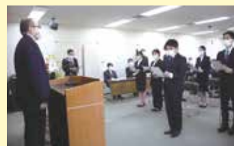
宣誓する新規採用職員