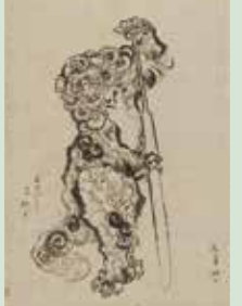
重要文化財・葛飾北斎筆「日新除魔図」のうち「逆鱗獅子図」 9月1日~10月11日に展示予定

なかでも注目は、重要文化財「日新除魔図」。富士山を描いた「富嶽三十六景」で有名な江戸時代の画家・葛飾北斎(1760~1894)が83歳~84歳のとき、朝の日課として獅子や獅子舞を描いた計219枚の作品です。獅子には魔よけの力があると信じられていたため、北斎は獅子を描くことで長寿を祈願したのです。格好いいものからユーモラスなものまでさまざまな獅子の姿を、躍動感ある筆の運びで描いた逸品です。時期により数枚ずつ入れ替えて展示しているため、いつ来ても見られますし、次に来れば前とは違う絵をご覧いただけます。お気に入りの一枚を探してみてください。