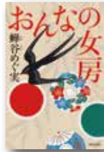
『おんなの女房』 蟬谷めぐ実 KADOKAWA