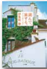
『読んで、旅する。』 伊集院静 小学館

●新型コロナウイルス感染拡大防止のため、来館の際はマスク着用などの協力をお願いします。