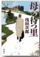
『母の待つ里』 浅田次郎 新潮社

市民図書館 TEL (921) 4646 FAX (921) 4896 http://www.library.dazaifu.fukuoka.jp/