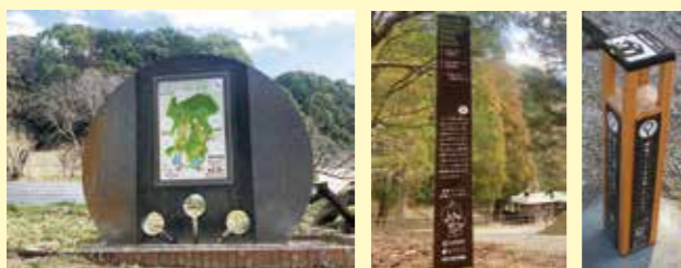
案内看板(左)にルーペなどの設置場所が書かれています。

市民の森は自然が多く残る史跡地で、季節ごとにさまざまな表情を見せる生き物が暮らしています。ぜひ市民の森を訪れ、隅々まで楽しんで歩き回ってください。心も体も健康になるとともに、新しい発見やワクワクする出会いが待っているかもしれません。