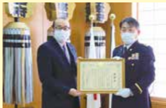
感謝状授受式の様子