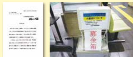
ロシアへの抗議文と市役所設置の募金箱

ロシアによるウクライナへの侵略について、本市は令和4年3月2日付でプーチン大統領宛て抗議文をロシア大使館に送付しました。