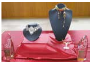
左：内閣総理大臣賞 「Twinkle～星影の記憶～」 右：台東区長賞「軌跡」