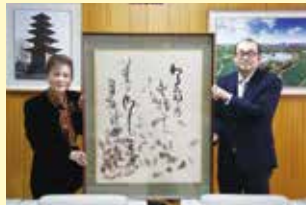
寄贈いただいた書