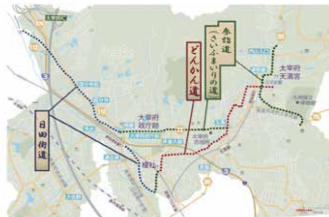
歴史的市街地の緑化推進事業対象路線図

1. 歴史的市街地の緑化推進事業 歴史的風情が次第に失われつつある門前・どんかん道・参詣道・日田街道の道沿いへの新規緑化に対する費用の一部を補助します。 申請対象となる場所 A・Bすべて満たす範囲 A: 図に点線で示す道筋沿い【日田街道・どんかん道・参詣道】 B: Aの道路境界から5mの範囲で、塀などで遮断されず外部から容易に眺望できるもの 対象樹種 太宰府市景観計画で「おすすめ樹種」に指定する万葉樹種および在来の樹木などで日本庭園をイメージし、季節感などで好ましい樹種