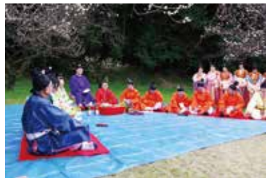
「万葉集つくし歌壇」梅花の宴

昨年新しく市民遺産となつた「四王寺山の三十三石仏」をはじめ、認定されている太宰府市民遺産全15件を紹介するパネル展を開催します。