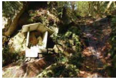
「四王寺山の三十三石仏」一番札所