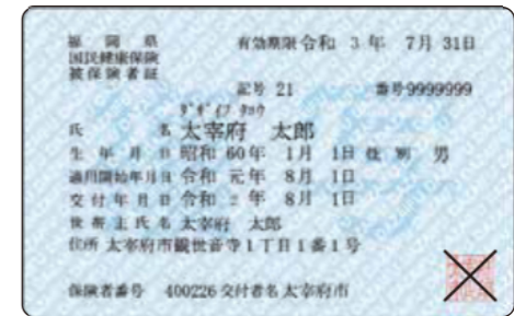
新しい保険証のイメージ

8月1日から使用する保険証を郵送します 新しい保険証(青色)は7月上旬から世帯主宛てに特定記録で郵送し、8月から使用できます。古い保険証(ピンク色)は8月に入ってから細かく裁断して破棄してください。 要「扱いとなっています。 納税相談を実施しています 国民健康保険税の未納があると、保険証の更新ができません。期限どりの納付が困難な場合は、納税相談をご利用ください。 問い合わせ 納税課(☎内線334・335)・市役所1階11番窓口 はり・きゅう受療証の更新申請もお忘れなく! はり・きゅう受療証の有効期限は7月末日です。引き続き必要な人は7月1日(水)以降に国保年金課で申請を行ってください。なお、はり・きゅう受療証の申請は随時受け付けています。 必要なもの 新しい保険証、認め印