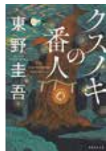
『クスノキの番人』 東野圭吾/著 実業之日本社