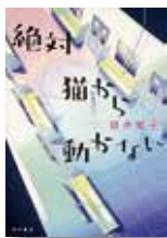
『絶対猫から動かない』 新井素子/著 KADOKAWA