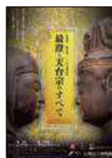
特別展 伝教大師1200年 大遠忌記念 「最澄と天台宗のすべて」