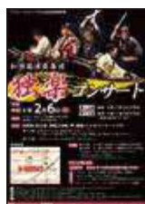
「和楽器演奏集団 独奏コンサート」