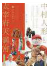
「中村人形と 太宰府天満宮」