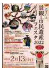
だざいふ景観・ 市民遺産フェスタ 2022 発行/太宰府市観光経済部観光推進課