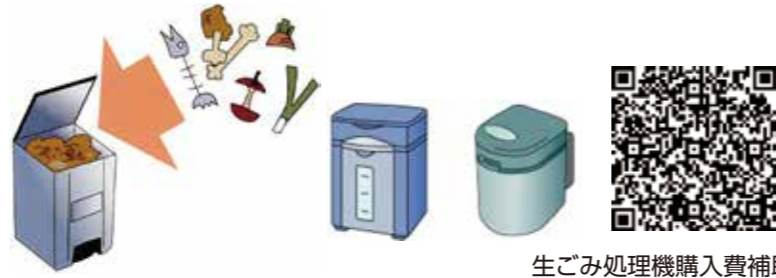
生ごみ処理機購入費補助金

(補助額) 購入額の2分の1(消費税額を含む) ただし、20,000円を限度とします。 1世帯につき1基