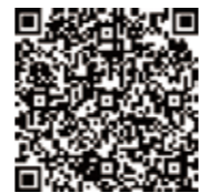
ダンボールコンポストで 生ごみを減量しよう

これら2つを実施するともえるごみが劇的に減ります。さらにご家庭のごみの嫌な臭い(生ごみの臭い)も減ります。生ごみ減量、ご検討ください。