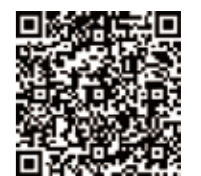
不法投棄は犯罪です！