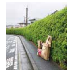
道路沿い玩具の包装紙