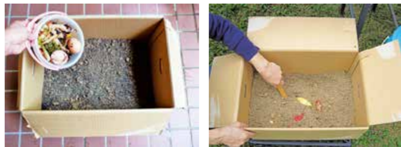
ダンボールコンポストで安全安心な堆肥を作ろう

販売場所: 太宰府市役所売店、NPO法人太宰府障害者団体協議会 ※新型コロナウイルスの感染拡大防止のため、休業中の場合があります。 セット価格: 850円