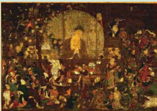
国宝「釈迦金棺出現図」(平安時代・11世紀、京都国立博物館)

このコラムでのイチ推しは国宝「釈迦金棺出現図」。仏教の經典によると、お釈迦様の生母の摩耶夫人は出産して間もなく亡くなり、天上界に生まれ変わりました。その後、お釈迦様が現世での死を迎えるとき、彼女も駆け付けたものの間に合わず、到着したのは棺に入れられた後。悲嘆に暮れる母のため、お釈迦様は神通力により復活して説法をしたのでした。その劇的な場面を巧みな筆遣いと構図や色彩で160cm×229.5cmの大画面いっぱいに描いた、日本仏教絵画で随一の傑作です。