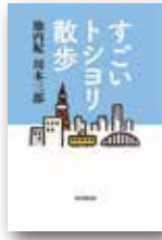
『すごいトシヨリ散歩』 池内紀、川本三郎 毎日新聞出版

●新型コロナウイルス感染拡大防止のため、来館の際はマスク着用などのご協力をお願いします。