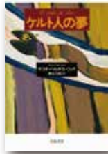
『ケルト人の夢』 マリオ・バルガス＝リョサ 岩波書店