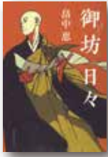
『御坊日々』 畠中恵 朝日新聞出版