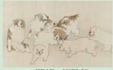
重要文化財 長沢戸雪筆「花鳥遊漁図巻」(部分) 江戸時代・18世紀、国(文化庁)所蔵

時代・地域・ジャンルといった難しいことはひとまずおいて、大人から子供まで「動物表現の魅力」を楽しんでもらいたい。そういう思いで集めたのは、古墳時代のハニワの馬、唐で作られたラクダの置物、鯛の形をした有田焼の皿、タイ北部の漆器の鹿形小箱、浮世絵師の葛飾北斎が描いた獅子など、多種多様な動物たち。重要文化財を含む名品ですから、見ごたえも充分。残念ながら生きている動物は展示していませんが、生き生きとした動物の姿を楽しめます。