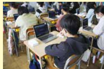
自作したプログラムでLEDを点灯させる児童たち

授業を受けた児童たちは、教材を実際に動作させることで視覚的にプログラムを理解することができていました。