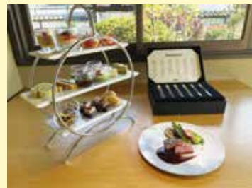
発表された新メニュー

HOTEL CULTIA 太宰府では、その土地の野菜などを使った地産地消のメニューにこだわっています。市においても、市内農産物の生産・出荷を増やすために地産地消推進補助金を交付し、梅をはじめとする太宰府の農産物を増やす取り組みにより農家のみなさんを応援しています。