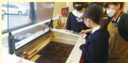
レーザーカッターを操作する生徒たち

参加した太宰府高校芸術科の生徒は、自らデザインしたネームプレートやスタンプなどをレーザーカッターで制作しました。デザインの考案から機器の操作まで、意欲的に楽しみながら取り組んでいました。