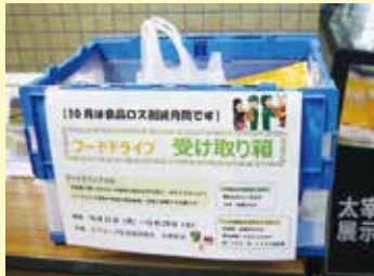
市役所に設置したフードドライブ受け取り箱

今後は市民の森のウォーキングコースの看板設置や宅配事業の周知などを通じて、市民の健康増進や利便性向上に向けて協働で取り組みます。