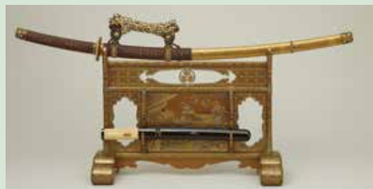
国宝 初音時絵刀掛 江戸時代 寛永16年(1639)、徳川美術館所蔵 ※会場では刀剣は展示されません。

将軍家のお姫様らしい華やかさのなかに、子を想う親のやさしさが感じられる「初音の調度」。年の初めにぴったりの展覧会です。