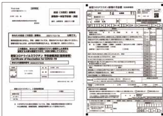
【接種券一体型予診票・済証】

1・2回目接種の時とは異なり、接種券(クーポン券)と予診票が一つになった「接種券一体型予診票・済証」を接種のお知らせなどとともに送付します。