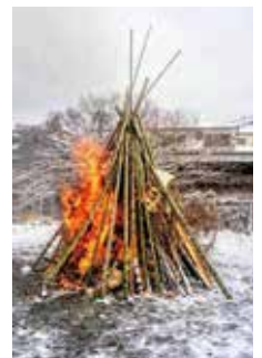
どんど焼きの様子

竹のやぐらを組み、正月飾りなどと一緒に燃やすことで無病息災などを願う行事です。ぜんざいや焼き芋がふるまわれることもあり、地域の交流の場となっています。