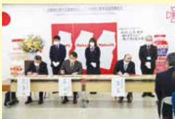
協定書にサインする三者の代表

今後とも、市民の安心・安全の確保を最優先に考え、柔軟な発想で取り組んでいきます。