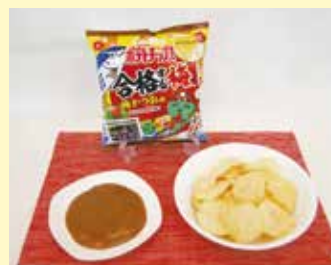
新製品 (左は原料の梅肉ペースト)