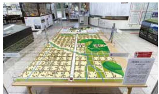
公開されたジオラマ

大宰府跡・水城跡の史跡指定100年の節目の年に、最新研究をもとに完成したジオラマです。ぜひご覧ください。