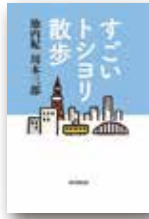
『すごいトシヨリ散歩』 池内紀、川本三郎 毎日新聞出版

●新型コロナウイルス感染拡大防止のため、来館の際はマスク着用などのご協力をお願いします。