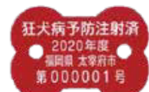
狂犬病予防注射済票 (令和2年度は赤色です)