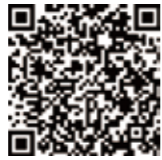
『消費者コーナー』ホームページ 公開ページID:2636

ホームページへ過去数年分のバックナンバーを掲載し、記事にイラストを交えて見やすく加工しています。プリントアウトすると、そのまま啓発用のチラシとして使用することもできますので、家族で見ているなど、ぜひ活用してください。