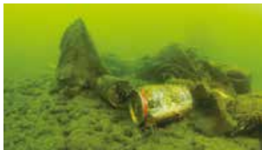
博多湾の海底の様子