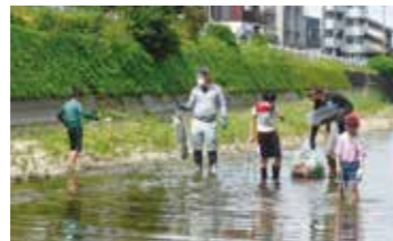
太宰府水から川の会主催 「御笠川クリーンデー」 小学生も参加しての 河川清掃活動の様子