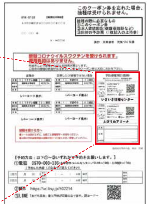
接種券(クーポン券)見本