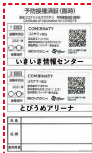
予防接種済証(臨時)

「 予防接種済証(臨時) 」や「 接種記録書 」を紛失していて、接種済証が必要な場合は、申請により市の接種済証明書を発行します。本人確認書類などを準備のうえ、まずは、ワクチン接種コールセンターに問い合わせてください。