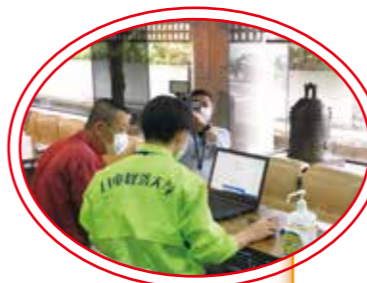
▶ 大学生による 予約サポートの様子