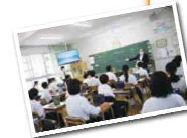
▶ 中学校のICT授業にて ワクチン接種予約について説明を行う楠田市長