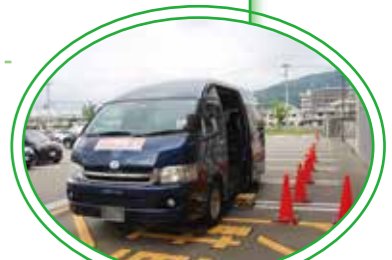
▶ 運賃無料のシャトルバス