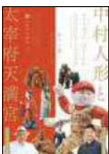
「中村人形と 太宰府天満宮」