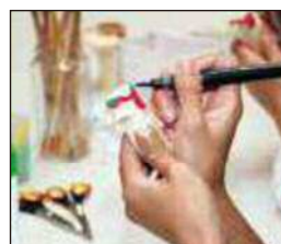
木うそ絵付け体験