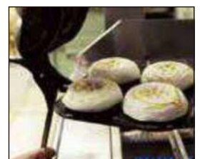
梅ヶ枝餅焼き体験