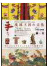
特集展示 琉球王国文化遺産集積・ 再興事業 巡回展 手わざ - 琉球王国の文化 -