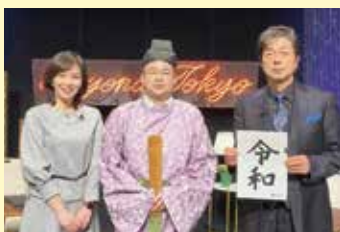
スタジオ収録後の出演者と楠田市長

番組では、「住みたくなる驚きの発見」や「そのまの魅力・売り」など、太宰府市の文化や特産、まの魅力をたっぷり紹介していただけます。皆さんぜひお見逃しなく！