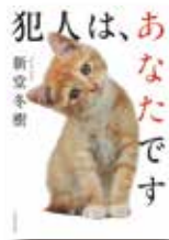
『犯人は、あなたです』 新堂冬樹/著 河出書房新社