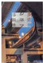
『歩道橋シネマ』 恩田陸/著 新潮社