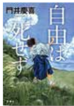
『自由は死せず』 門井慶喜/著 双葉社